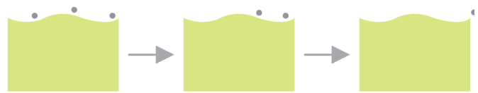
Sheer (im Zeitverlauf)