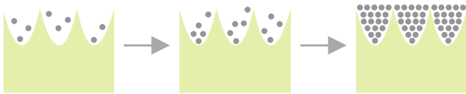
Herkömmliches Duschglas (im Zeitverlauf)